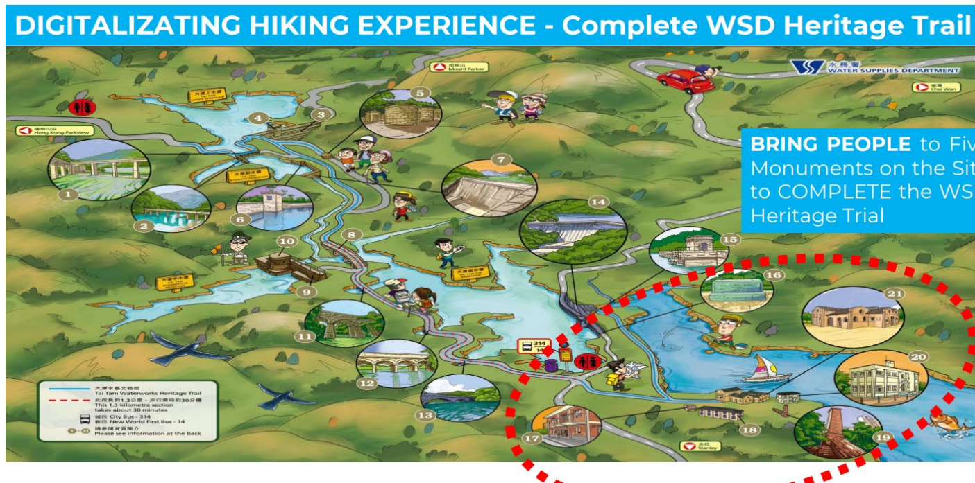
圖：「e.a.r.t.h.計劃」會將紅圈內的 5 個大潭水務文物徑景點與其餘景點作整合，讓遊客可以透過 21 個景點全面認識香港大潭的水務歷史。（圖片來源：水務署）