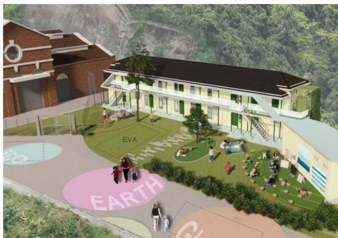
相片(左)及構思圖 1(右)：大潭篤原水抽水站員工宿舍（左）經活化改建後將會成為 Earth Campus 的教學樓（右）。